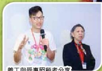
義工與受惠照顧者分享