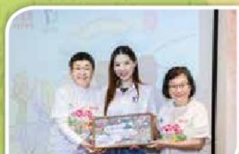
家福會執行委員致送紀念品予怡珊亞洲慈善基金代表

完成這個閉幕活動後，因著整日的陪伴遊覽，義工深深感受到照顧者的辛勞及壓力；同時更看到辛勞照顧者下無比的耐心與溫柔。大部分義工均表示首次參與持續性義工活動，感受更深刻之餘，同時更看到擔任義工的價值；義工更表示期望可提供更深化的服務，更進一步支援智力障礙家庭。