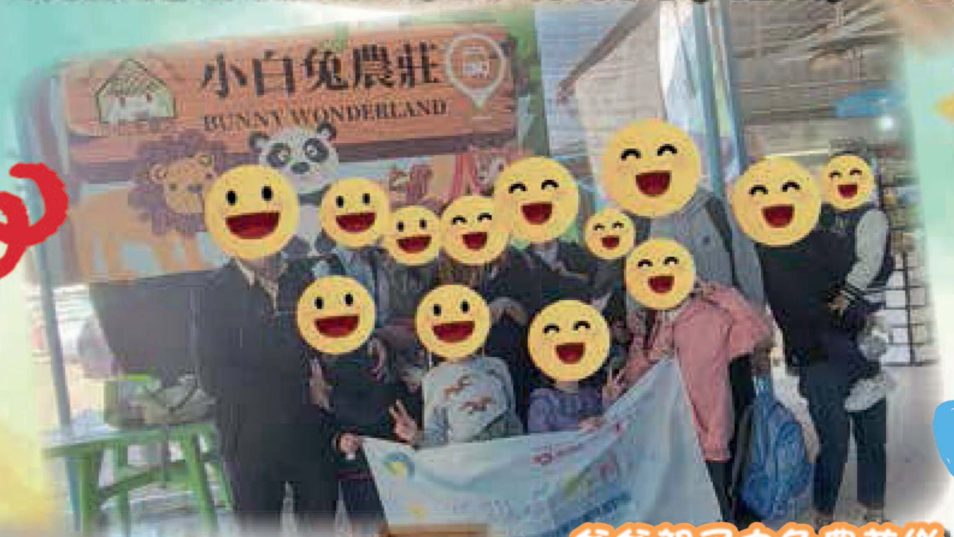
爸爸親子白兔農莊樂