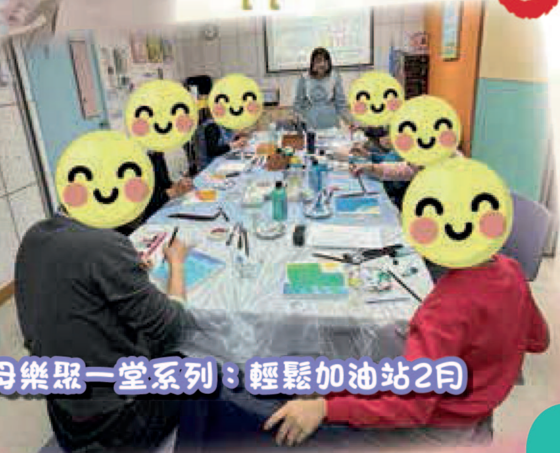
祖父母樂聚一堂系列：輕鬆加油站2月