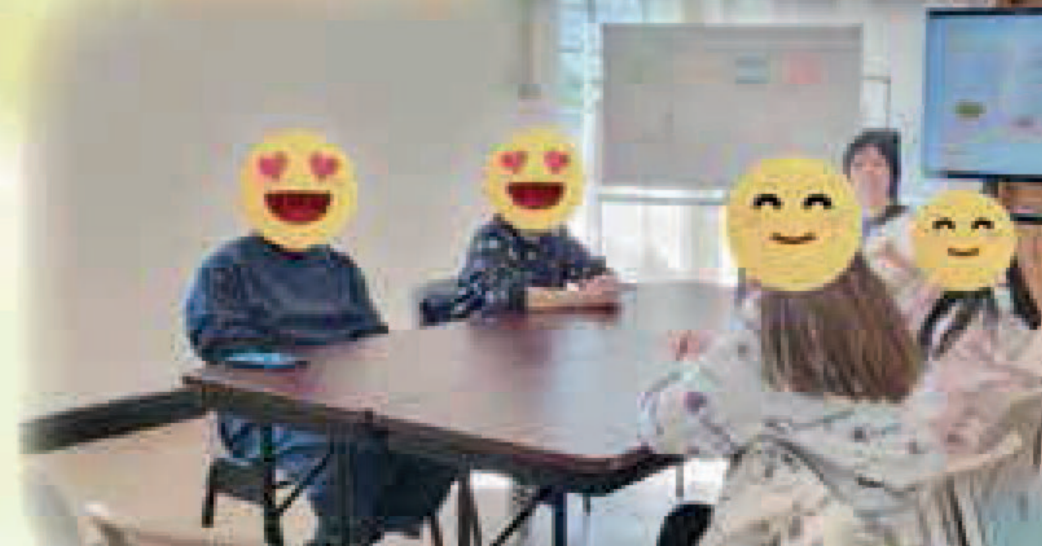
「大手牽小手」家長月聚