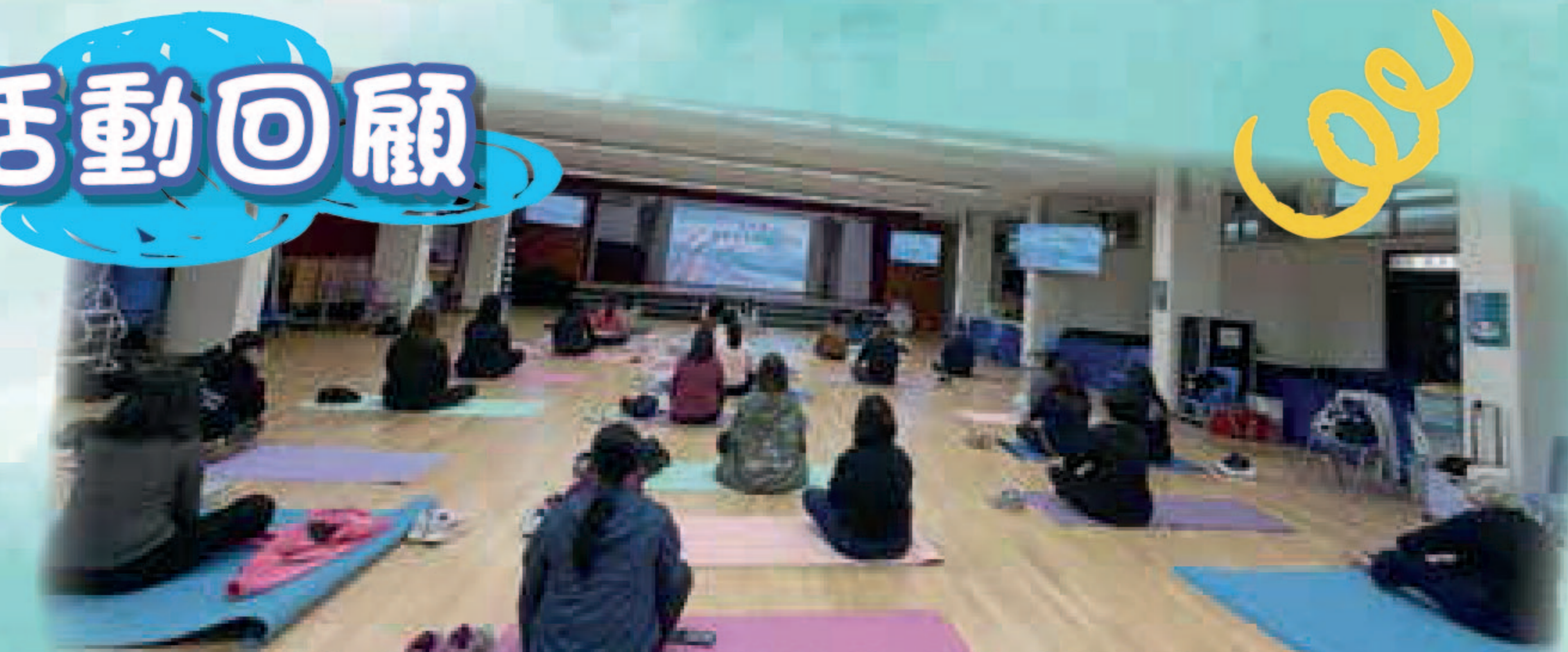
「安定身心」家長工作坊@道教青松小學(湖景邨)