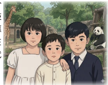
(此圖為 AI 生成的示意圖，模擬三代同堂的畫面效果)