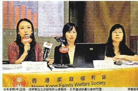
香港家庭福利會 Hong Kong Family Welfare Society